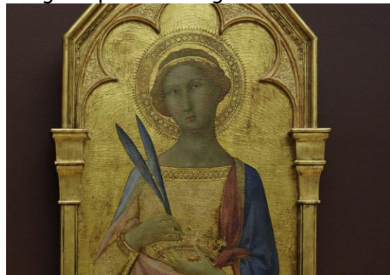
De heilige Corona, Sienna, circa 1350

De relieken van de tot voor kort onbekende heilige Corona zijn uit de catacomben van de Dom van Aken tevoorschijn gehaald, afgestoofd en opgepoetst om aan het grote publiek te laten zien. Corona van Egypte leefde rond 160 na Christus en stierf een heiligendood. Zij kan worden aangeroepen voor rugklachten maar